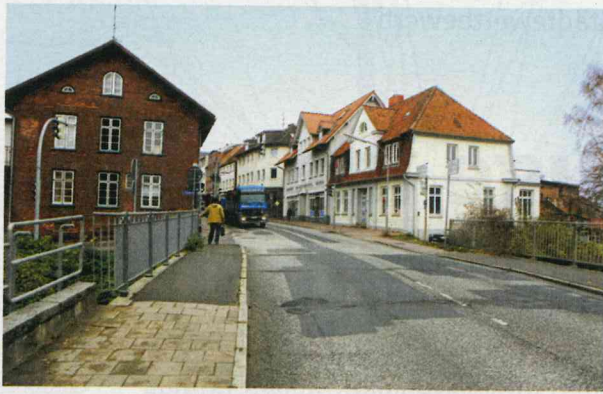
Ratzeburg zurzeit: Über die zweispurige Seestraße rumpeln täglich 18 000 Autos – mitten durch die historische Altstadt