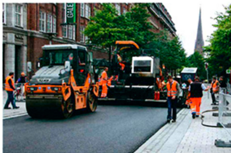
Die STORIMPEX Unternehmensgruppe hat im Auftrag der Stadt Hamburg die Mönckebergstraße im Sommer 2012 mit der Maximalrecycling-Methode erneuert